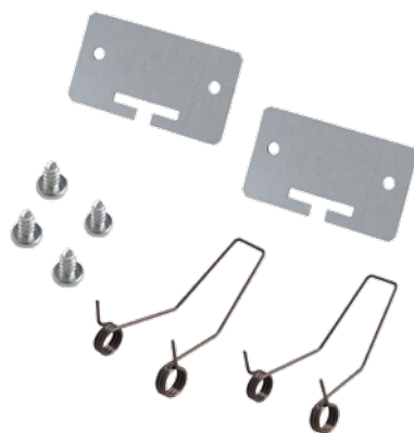
ZESTAW MONT. P/T iTECH