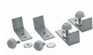
CLP-REGIS 418 PT