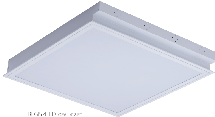
REGIS 4LED OPAL 418 PT