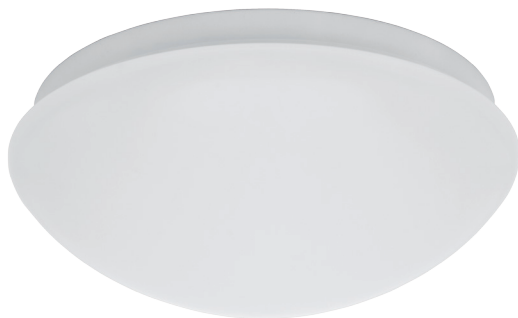
PIRES ECO DL-250