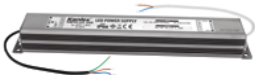
TRETO LED 30W