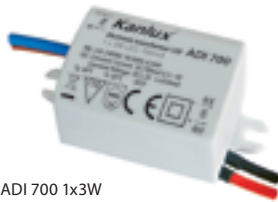
ADI 700 1x3W