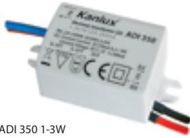
ADI 350 1-3W